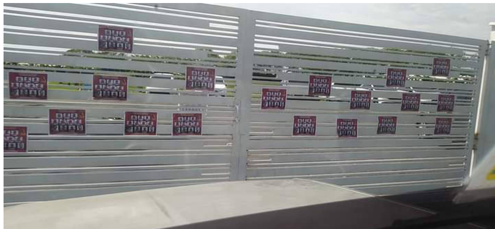
Imagen del panfleto que aquí denunciamos, pegado en la puerta de la sede deportiva del Tolima.